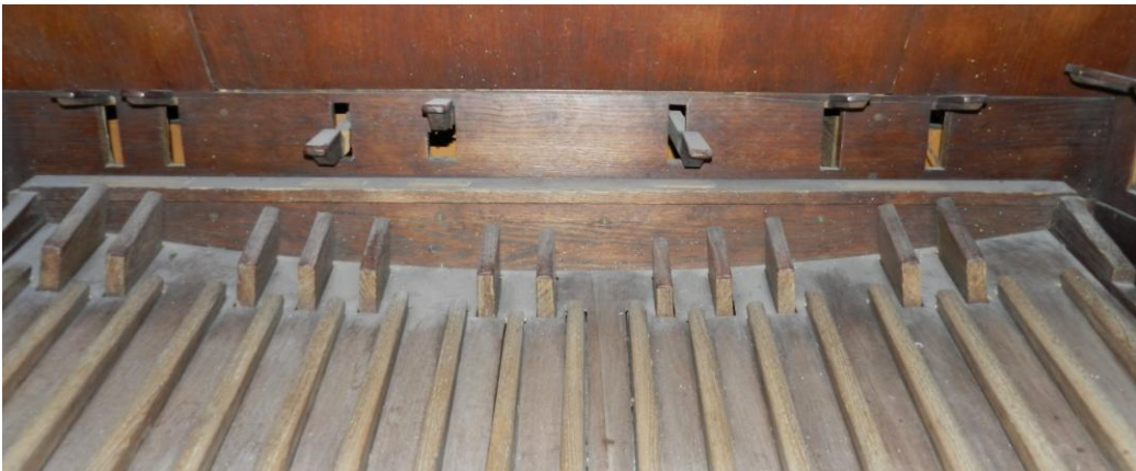
la pedaliera ed i registri, sporchi e rovinati