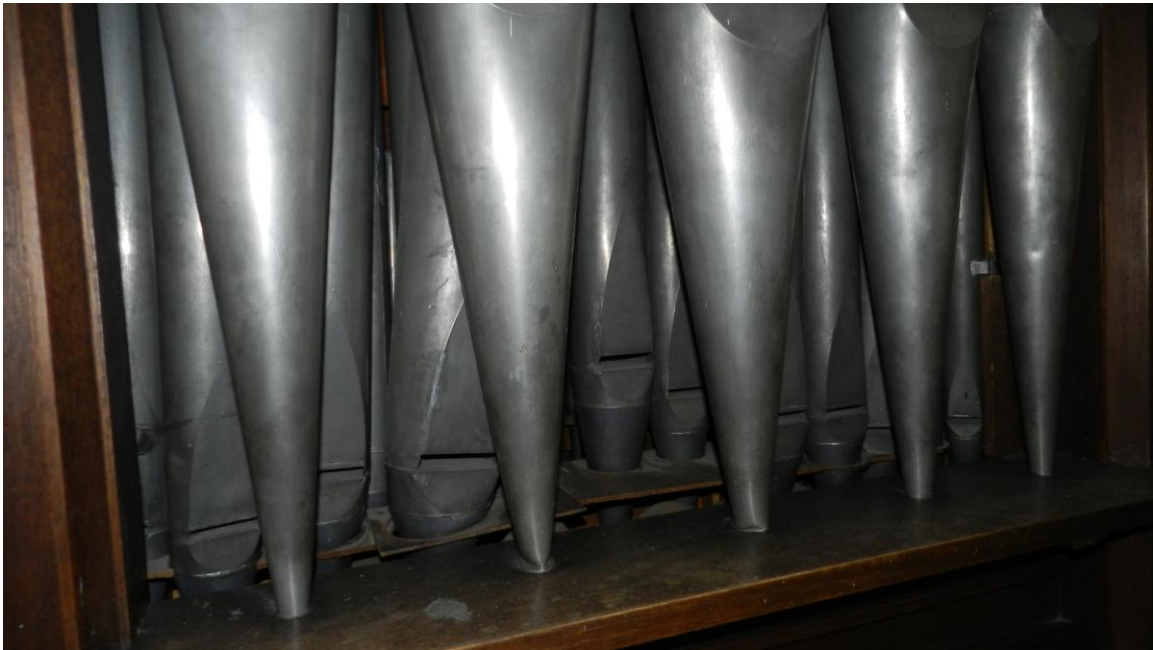
Le canne alla base risultavano in più punti piegate

Lo stato dell'organo realizzato da Bartolomeo Formentelli, come si presentava nel Luglio 2014.