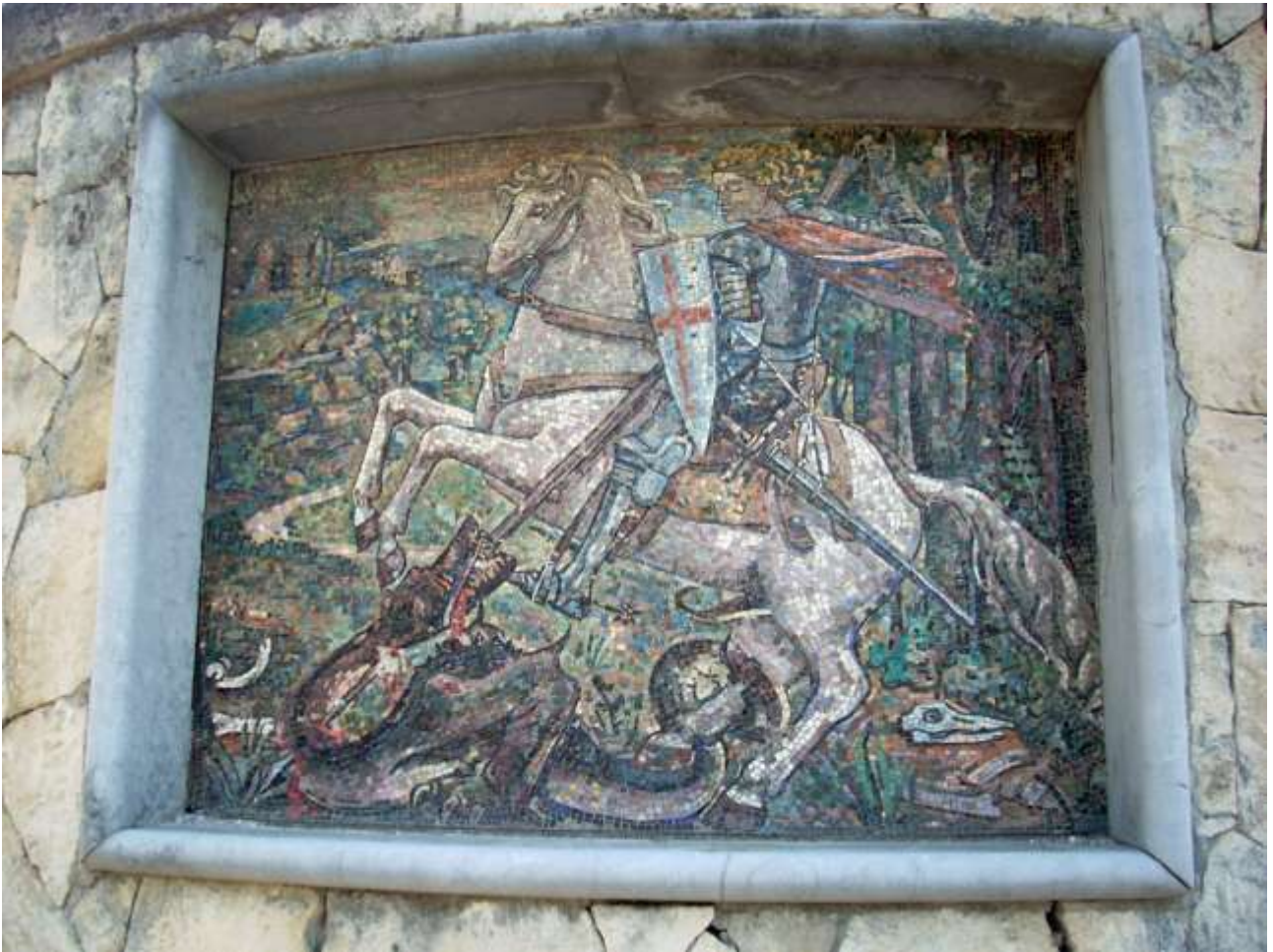
Il mosaico opera di G. Salietti su disegno di Oscar Saccarotti che campeggia sul muro di cinta del comprensorio della Villa Girasole.